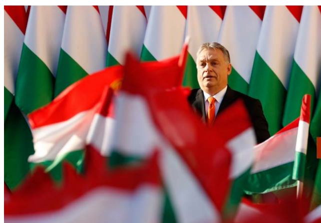
Victor Orbán, Ungerns premiärminister sedan 2010.

Innehåll i artikeln som har med nationalism att göra: _____